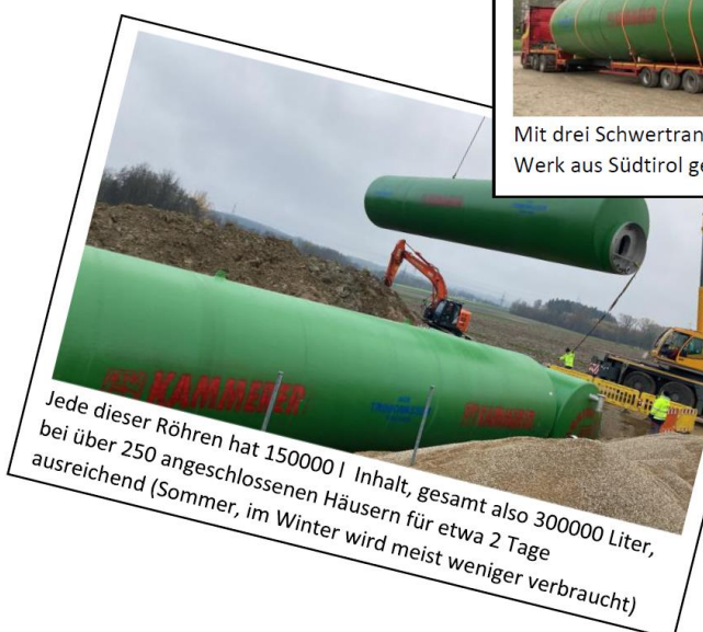
Jede dieser Röhren hat 150000 l Inhalt, gesamt also 300000 Liter, bei über 250 angeschlossenen Häusern für etwa 2 Tage ausreichend (Sommer, im Winter wird meist weniger verbraucht)