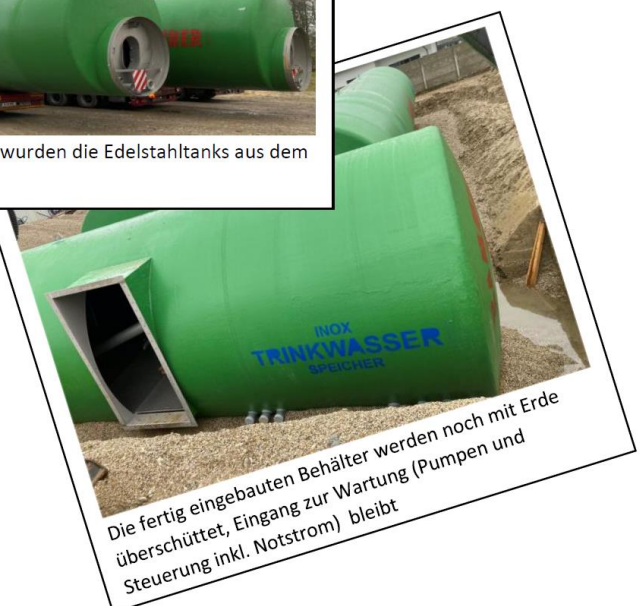
Die fertig eingebauten Behälter werden noch mit Erde überschüttet, Eingang zur Wartung (Pumpen und Steuerung inkl. Notstrom) bleibt