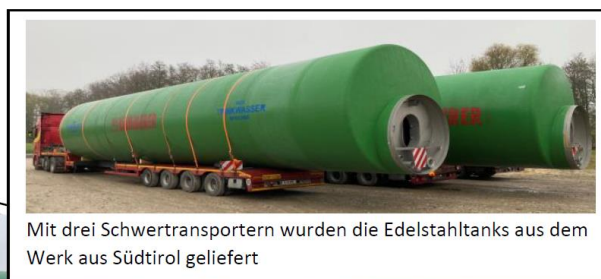
Mit drei Schwertransportern wurden die Edelstahltanks aus dem Werk aus Südtirol geliefert

Somit ist die Trinkwasserversorgung unseres schönen Ortes gesichert. Seitens der Behörde wurde uns vorgeschrieben, in den nächsten Jahren einen zusätzlichen Wasserspender als Notversorgung zu finden, wir sind zuversichtlich, dass auch dies gelingen wird.