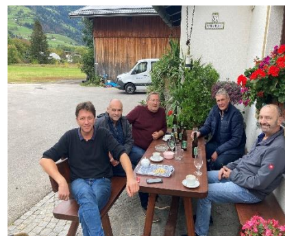
Im Gespräch mit einem Landwirt und alten Freund Rottenbachs aus Osttirol