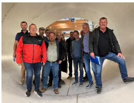
Rottenbacher in einem unserer Trinkwasserbehälter vor dessen Fertigstellung.

Eine Bildungsreise führte Ende September zahlreiche Gemeinderäte und Mitglieder der örtlichen Feuerwehr nach Südtirol. Beim Werksbesuch in der Fa. Kammerer Tankbau in Kiens wurde hinter die Kulissen der Fertigung unserer Trinkwassertanks geschaut. Weiters erhielten wir tolle Einblicke in die Landwirtschaft und den Fremdenverkehr dieser Region.