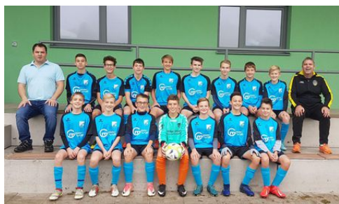
U15 SPG Rottenbach/Hofkirchen