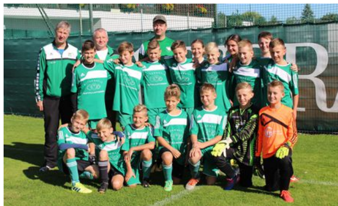
U13 SPG Rottenbach/Haag/Geboltskirchen