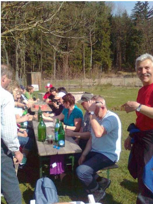
Bei jeder Etappe waren ca. 25 Personen dabei.

Von dort ging es über Gotthaming nach Geierau wo wir die Fernstrasse überquerten und über Pommesberg nach Schachet gingen. Von Schachet gingen wir Richtung Weibern an Grub und Hofreith vorbei zur Weiberer Bundesstrasse wo wir dann wieder nach Rottenbach kamen. Die Gehzeit war hier viereinhalb Stunden.