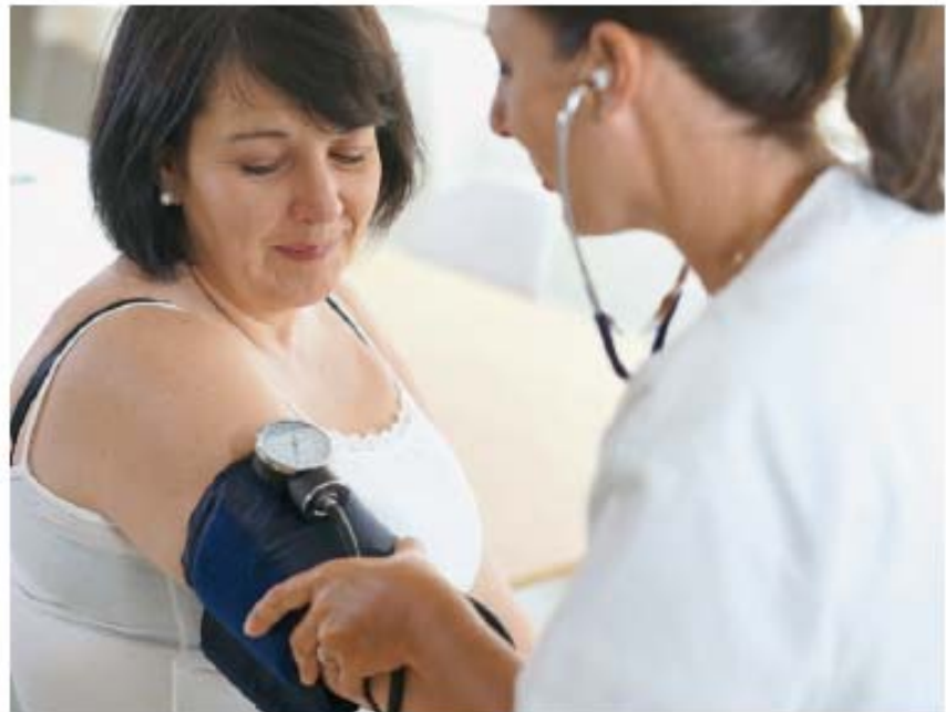
Stehen Sie unter Druck?