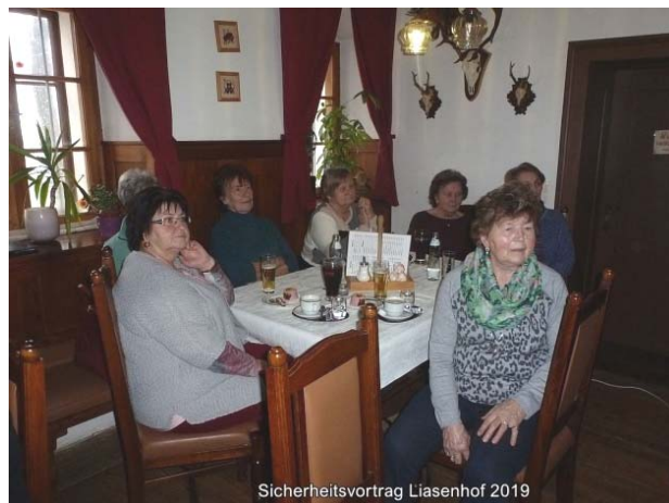
Sicherheitsvortrag Liasenhof 2019