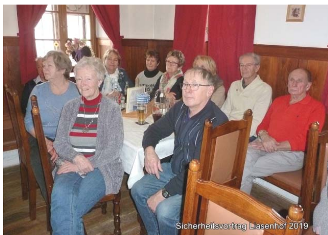
Sicherheitsvortrag Liasenhof 2019