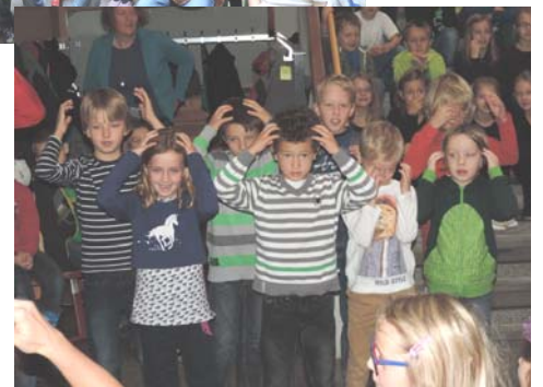
Die Schüler und das Lehrerteam der VS Rottenbach