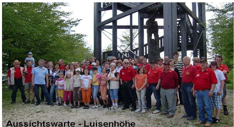
Aussichtswarte - Luisenhöhe

Wetter an der Hausrückwanderung – dem Weg der Sinne – zur Aussichtswarte – weiter zum Mostheurigen Möseneder auf eine stärkende Mahlzeit -ein Bratln in der Rein. Wo dann der Familienwandertag in gemütlicher Runde den Ausklang fand. Für die zahlreiche Beteiligung bedankt sich das AMTC – Team