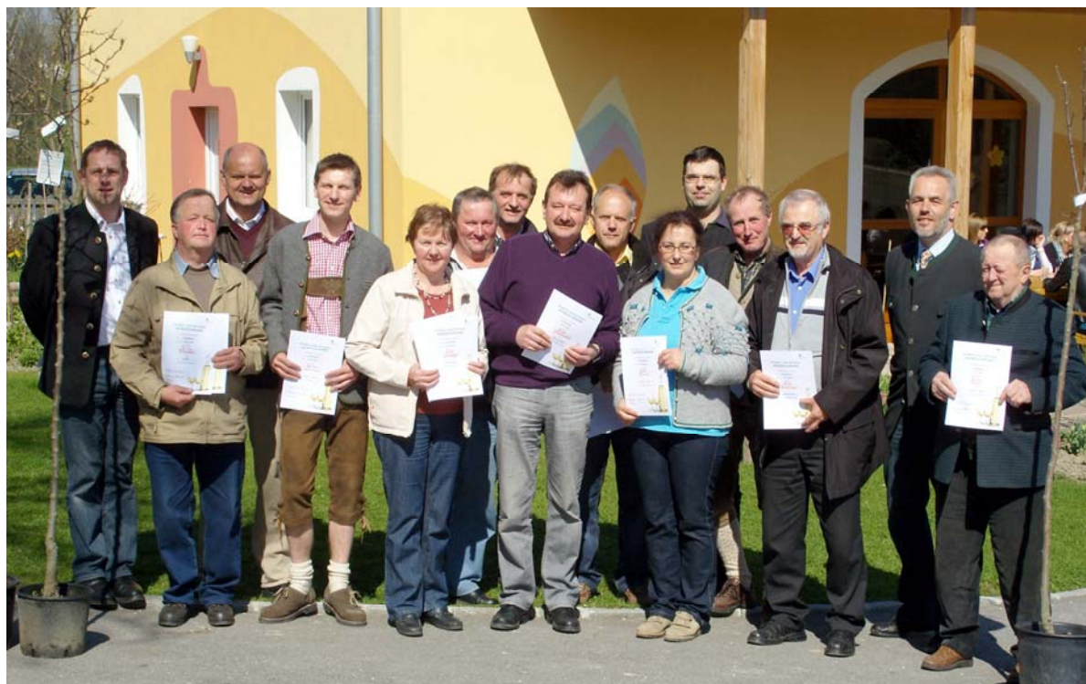
Die ausgezeichneten Mostproduzenten sind zu Recht stolz auf ihre Urkunden.

Das genaue Bewertungsergebnis ist im Schaukasten der Ortsbauernschaft nachzulesen. Geheimtipp: Einige der prämierten Moste sind auch ab Hof käuflich zu erwerben - am besten kurz mal nachfragen!