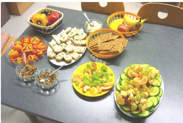
Ein Teil unseres Jausenbuffets, jeweils am Mittwoch

Wir bedanken uns ganz herzlich beim Verein "Gesunde Gemeinde Rottenbach" für die großzügige Spende in der Höhe von EUR 250,--. Die Teilnahme unseres Kindergartens an dem Projekt "Gesunde Jause im Kindergarten" ist bereits zum fixen Bestandteil unserer Jahresplanung geworden und ist ein wertvoller Beitrag zur Gesundheitsförderung unserer Kinder. Einen Teil der Spende möchten wir in den Ankauf von Bilderbüchern investieren, die heuer den Jahresschwerpunkt in unserem Kindergarten bilden.