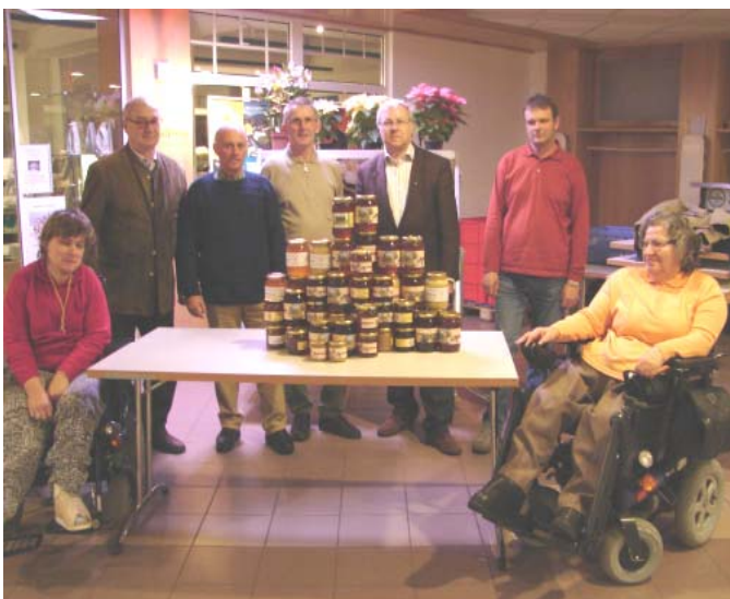
Honigspende für Behindertendorf Altenhof

Es wird eher weniger Imker mit mehr Völkern geben.